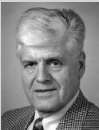
Ragnar Arnalds, medlem af Islands Alting (Folketing/Riksdag/Storting) 1963-1967 og 1971-1999. Finansminister 1980-1983. Ragnar Arnalds er idag leder af den tværpolitiske EU-kritiske tænketank Heimssyn. (Heimssyn betyder „udsigt mod verden“)

I EU är der många som tror att fiskeriproblemet kan lösas preliminärt i en övergångsperiode med en kompensation, i stedet för fiskekvoter som tappas, i form av pengar til rederier och fiskare. Men den slags ideer får ingen tilslutning i Island. Det är fiskeriet som har varit ekonomiens grundval och vi ønsker inte att driva vår viktigaste næringsgren med understöd. Det är en osund metod, økonomisk. Man må