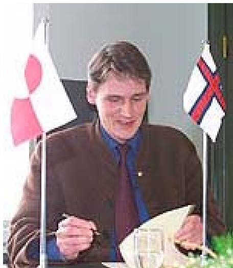
Høgni Hoydal er MF for Den Nordatlantiske Gruppe, tidl. medlem af Nordisk Råd og tidl. minister for nordisk samarbejde

at have det danske mindretal i Sydslesvig. Det ville jo være langt billigere og rationelt at have et eller få sprog og få kulturer. Og der har faktisk været ekspertgrupper, der i den økonomiske rationalitets navn har foreslået at eksportere Færing til Esbjerg og at flytte grønlændere sammen og droppe en særrønlandsk kultur. I Grønland blev det desværre også til en vis grad gennemført i 60'erne. Men som en færøsk forfatter skrev engang: Vi bor ikke på Færøerne af praktiske årsager. Og det har han jo fuldstændig ret i. Vi bor der fordi vi elsker landet, fordi vi har et kulturelt fællesskab og fordi vi vil bevare og udvikle de værdier og erfaringer, som folk har opbygget på øerne over tusinde år. Og vi bor der fordi vi tror på, at det er muligt at bygge et moderne samfund på disse værdier.