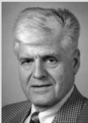
Ragnar Arnalds er tidligere islandsk finansminister

Det er derfor vigtigt, at vi kommer med et bud på alternativer. En bedre koordinering af de nordiske landes udenrigspolitikker vil være mere effektiv og fredsorienteret end EU's udenrigspolitik. De nordiske lande har stor goodwill i verden og har haft stor indflydelse i FN gennem årene.