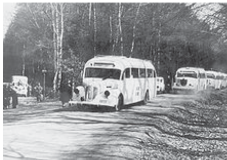
Hvide busser på vej op gennem Holsten

Udover hjælpen til de norske skolebørn organiserede Hjælpefonden også mad til norske fanger i tyske koncentrationslejre. Hjælpefonden havde officiel tilladelse til sit virke; men fik naturligvis gennem hjælpearbejdet kontakt også til illegale kredse i Norge; det kom til at koste Carl Hammerich livet, da han arresteredes i 1944 og omkom under englændernes bombardement i marts 1945 af Gestapos hovedkvarter i København, Shellhuset, hvor han sad som fange.