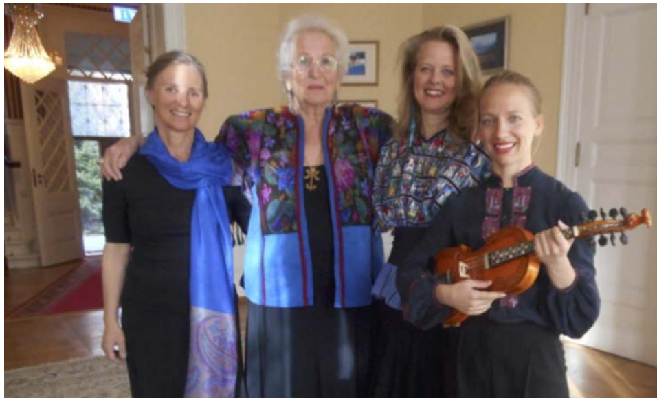
Foto er fra den flotte forestillingen vi havde i Russiske Ambassade 11 april, med de fire kunstnerene som blir med på turen

stedet. Dette blev formidlet af en dygtig russisk- norsk talende guide.