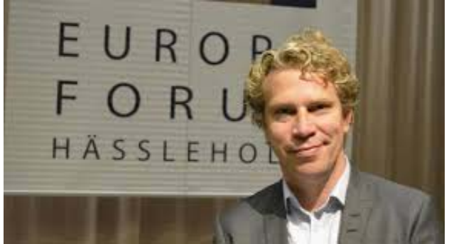
von Sydow er direktør for det Svenske Institut for Europapolitiske Studier.

“..dessa länder har relativt ofta delat britternas syn på EU.”