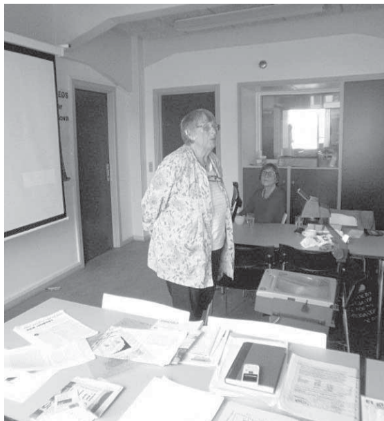
Den norska fredsrörelsens och kvinnokampens grand old lady, Berit Ås, i "talarstolen."

I hållande regn avslutades så Folkriksdagen följande dag med en kanaltur och besök på Nordatlantens brygge, där ett par av de gamla packhusen renoverats och blivit säte för Färöarnas och Islands kulturhus.